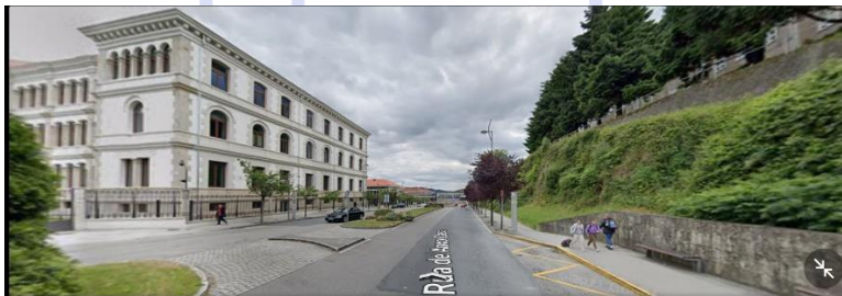
1 Rúa de Anxo Casal